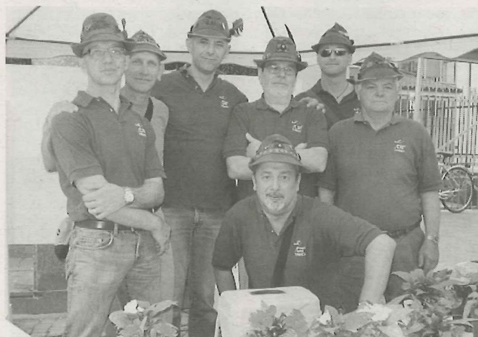
Trino in piazza: il gazebo degli Alpini