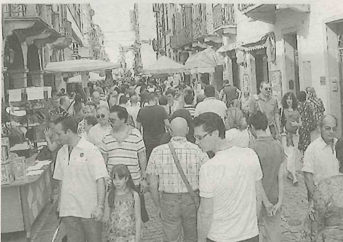
Numerosi visitatori per gli oltre sessanta stand